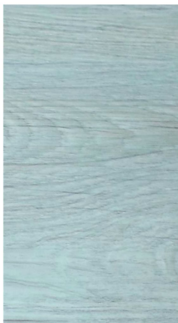
Gris Maple W4903