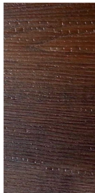
Roble Americano W4901